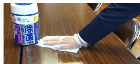
テーブルなどの除菌消毒