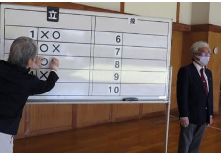
射場委員もマスク、ビニール手袋をつけることが望ましい