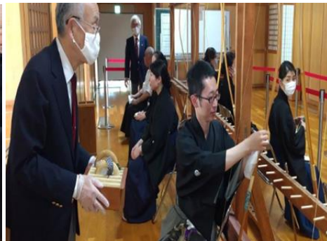
替え弓とマスクを入れた袋を渡す。