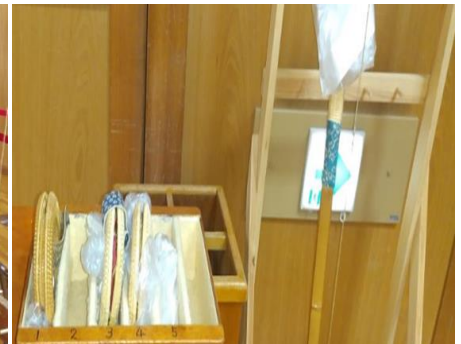
替え弦、替え弓、マスクを管理